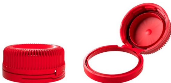
(26-22 images) Design premium de bouchon à vis avec charnière pour tout type de boisson