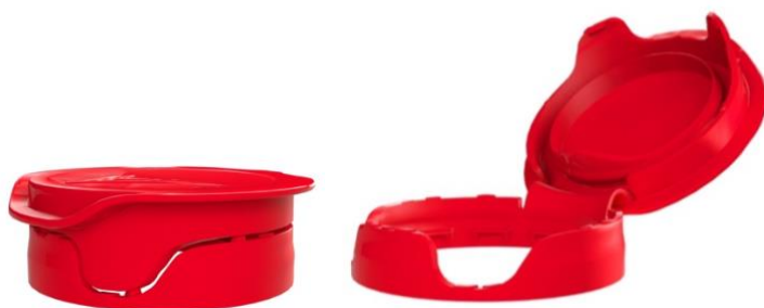
(SD3B images) Snap-on design. Technologie conforme pour les boissons qui ne sont pas présurisées, telles que l'eau plate