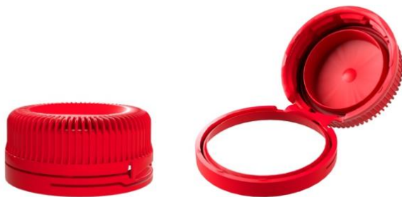
(26-22) Schraubverschluss mit Scharnier als Premium-Lösung für alle Arten von Getränken.